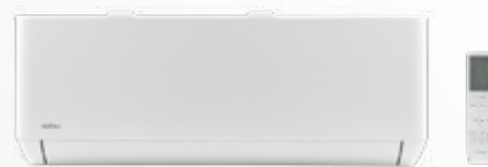
UI Pared Artic Plus