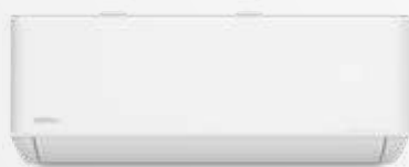
UI Pared Artic