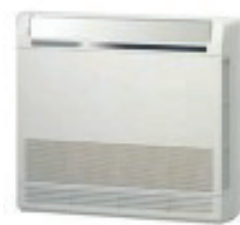
2.6 & 3.5 kW