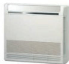
2,6 e 3,5 kW