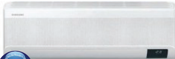
(un. interior compatível com FJM - Multi-Split)

1 - Disponível em Português e outras línguas 2 - Precisa de Módulo de interface comercializado em separado