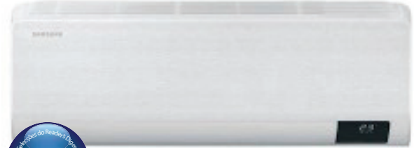
(un. interior compatível com FJM - Multi-Split)