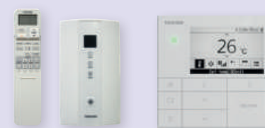
DI SERIE 2