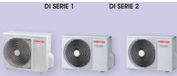
DI SERIE 1